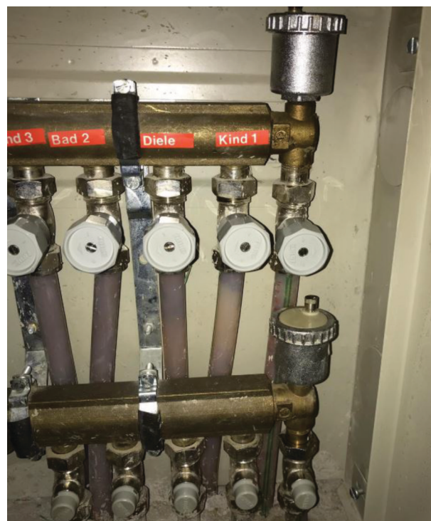
— Abb. 1.2 Spülung von Bodenheizungen