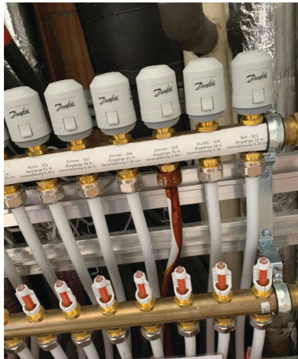
— Abb. 1.1 Spülung von Bodenheizungen