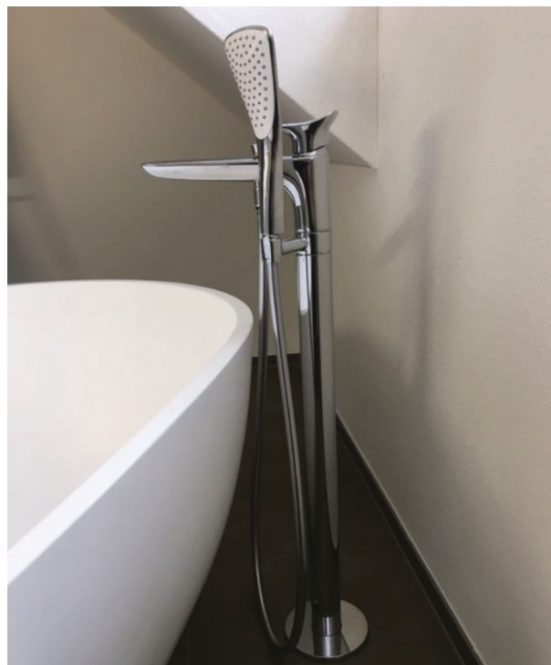
— Abb. 1.2 Stand Bademischer Nachher