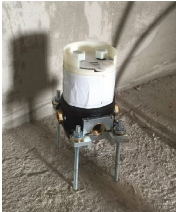
— Abb. 1.1 Stand Bademischer Vorher