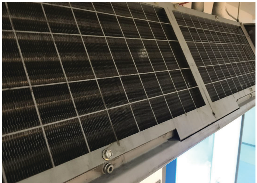
— Abb. 1.2 Wartung & Reinigung - Torluftscheier - Nachher