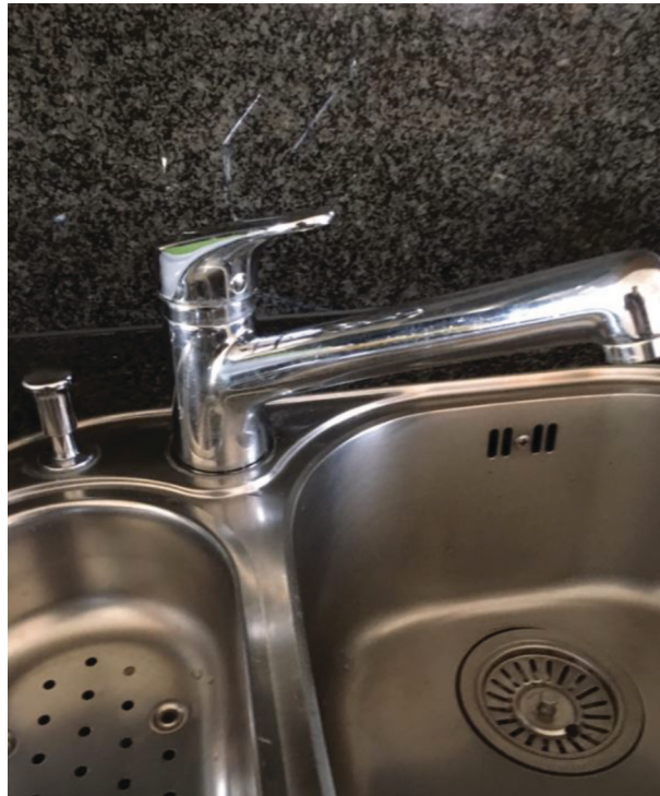
— Abb. 1.1 Küchenmischer Ersetzen Vorher