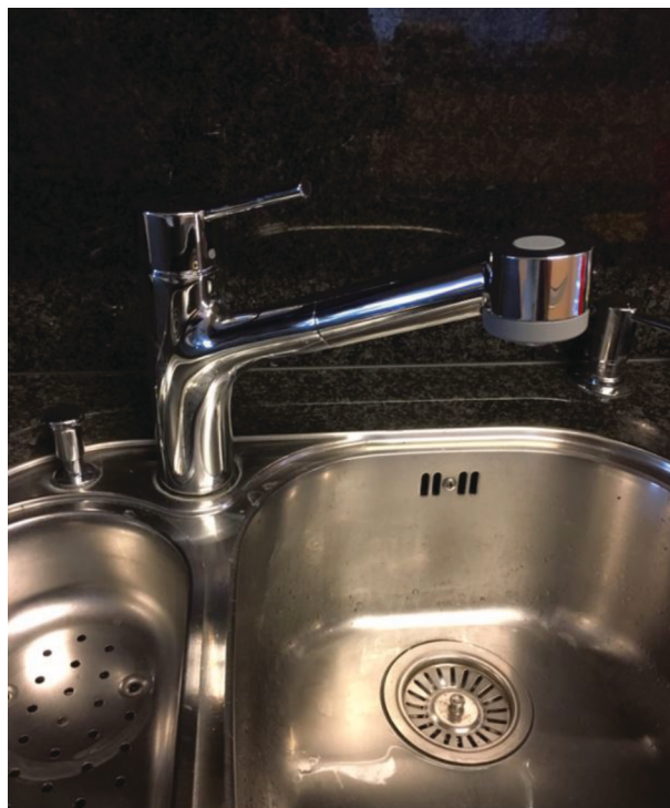
— Abb. 1.2 Küchenmischer Ersetzen Nachher