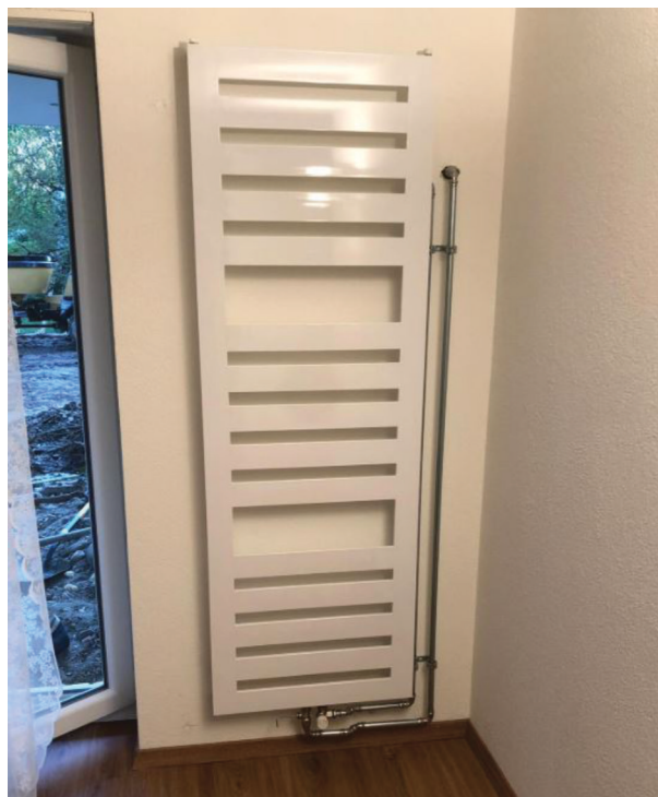
— Abb. 1.2 Heizkörper Ersetzen Nachher