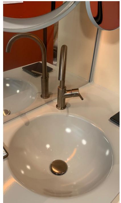
— Abb. 4 Hotel, 4600 Olten