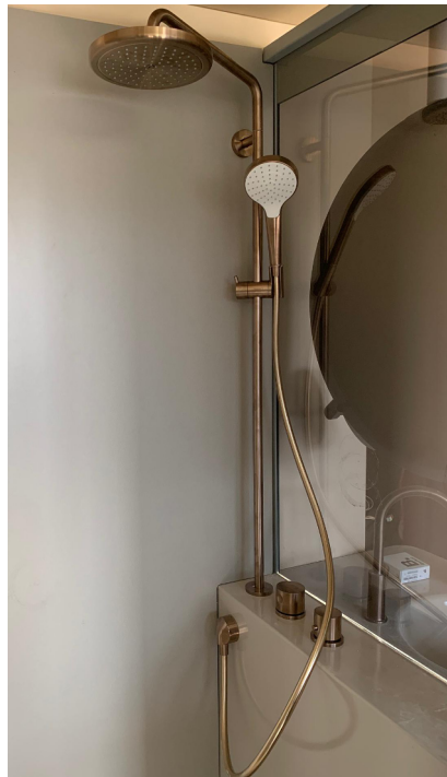
— Abb. 3 Hotel, 4600 Olten