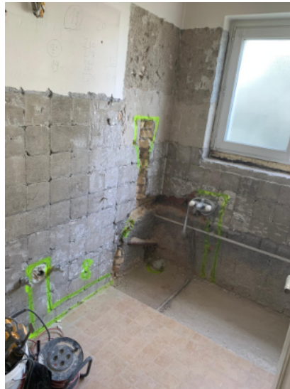
— Abb. 1 Wohnung, 8049 Zürich