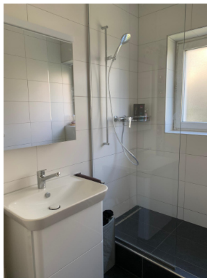
— Abb. 3 Wohnung, 8049 Zürich