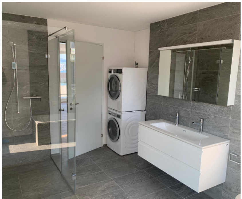
— Abb. 3 8708 Männedorf