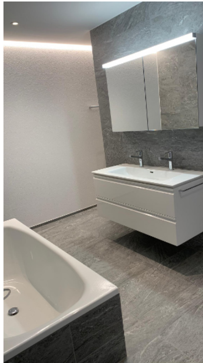
— Abb. 1 8708 Männedorf