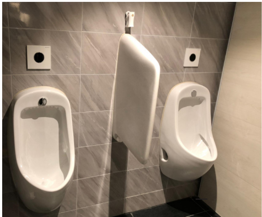
— Abb. 3 Asylstrasse, 8032 Zürich