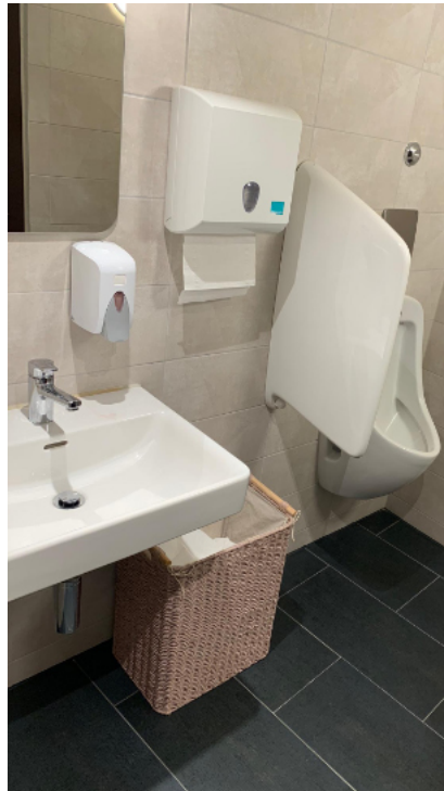
— Abb. 1 Asylstrasse, 8032 Zürich