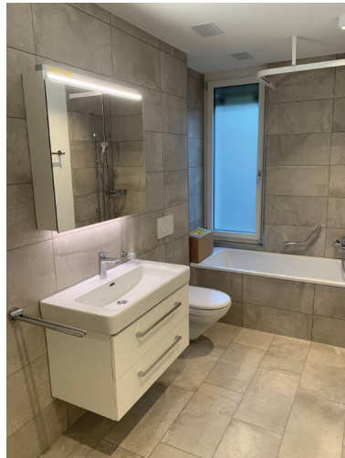
— Abb. 1 MFH, 8424 Embrach