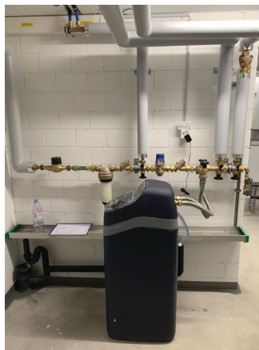
— Abb. 3 MFH, 8424 Embrach