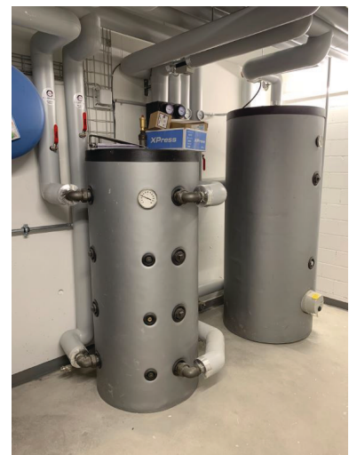
— Abb. 3 MFH, 8424 Embrach