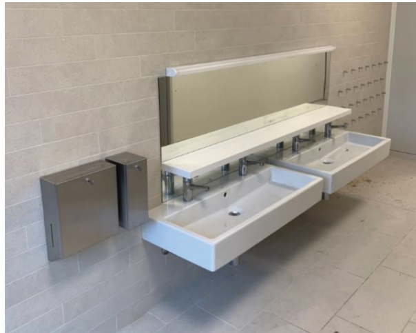
— Abb. 1 Kita, 8002 Zürich