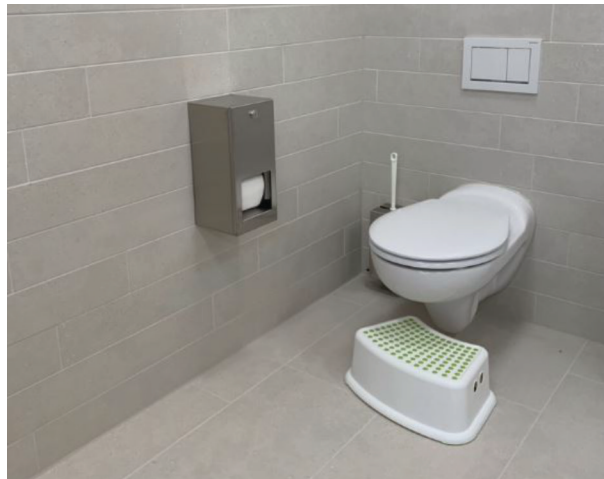
— Abb. 2 Kita, 8002 Zürich