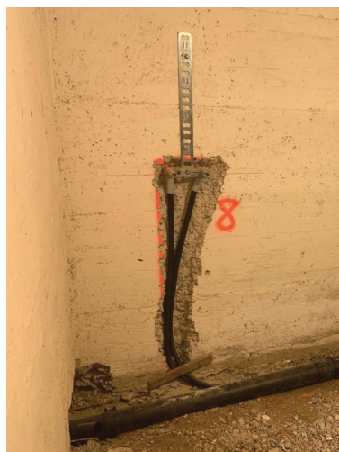
— Abb. 2 Vorher