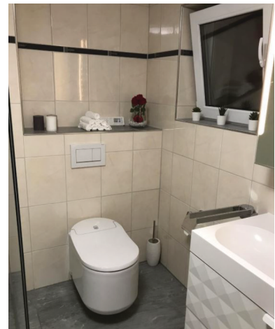
— Abb. 1.1 Nachher