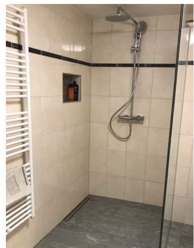
— Abb. 2.1 Nachher