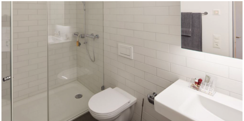
— Abb. 3 Bülachguss, 8180 Bülach