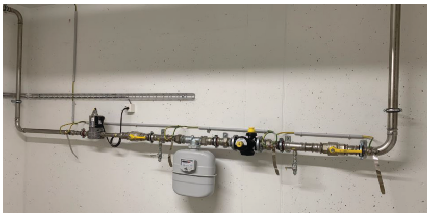
— Abb. 4 Bülachguss, 8180 Bülach