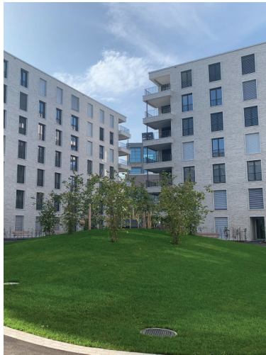
— Abb. 1 Bülachguss, 8180 Bülach