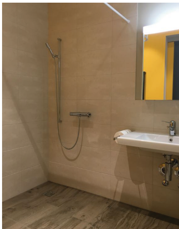
— Abb. 2 Almacasa, 8045 Zürich