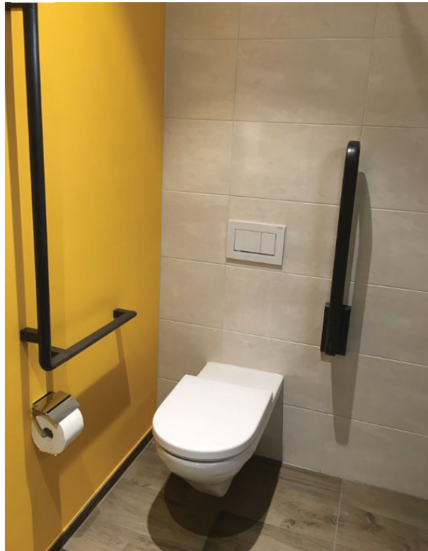
— Abb. 1 Almacasa, 8045 Zürich