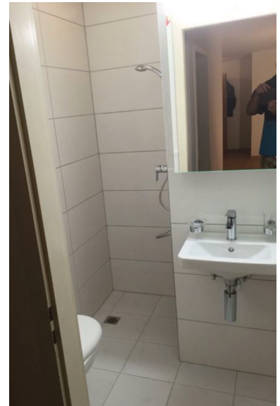
— Abb. 1.1 Nachher