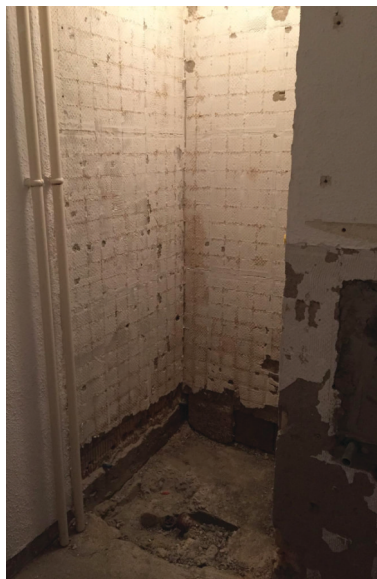
— Abb. 2 Vorher