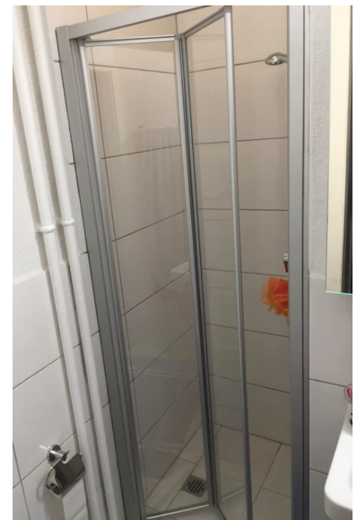
— Abb. 2.1 Nachher